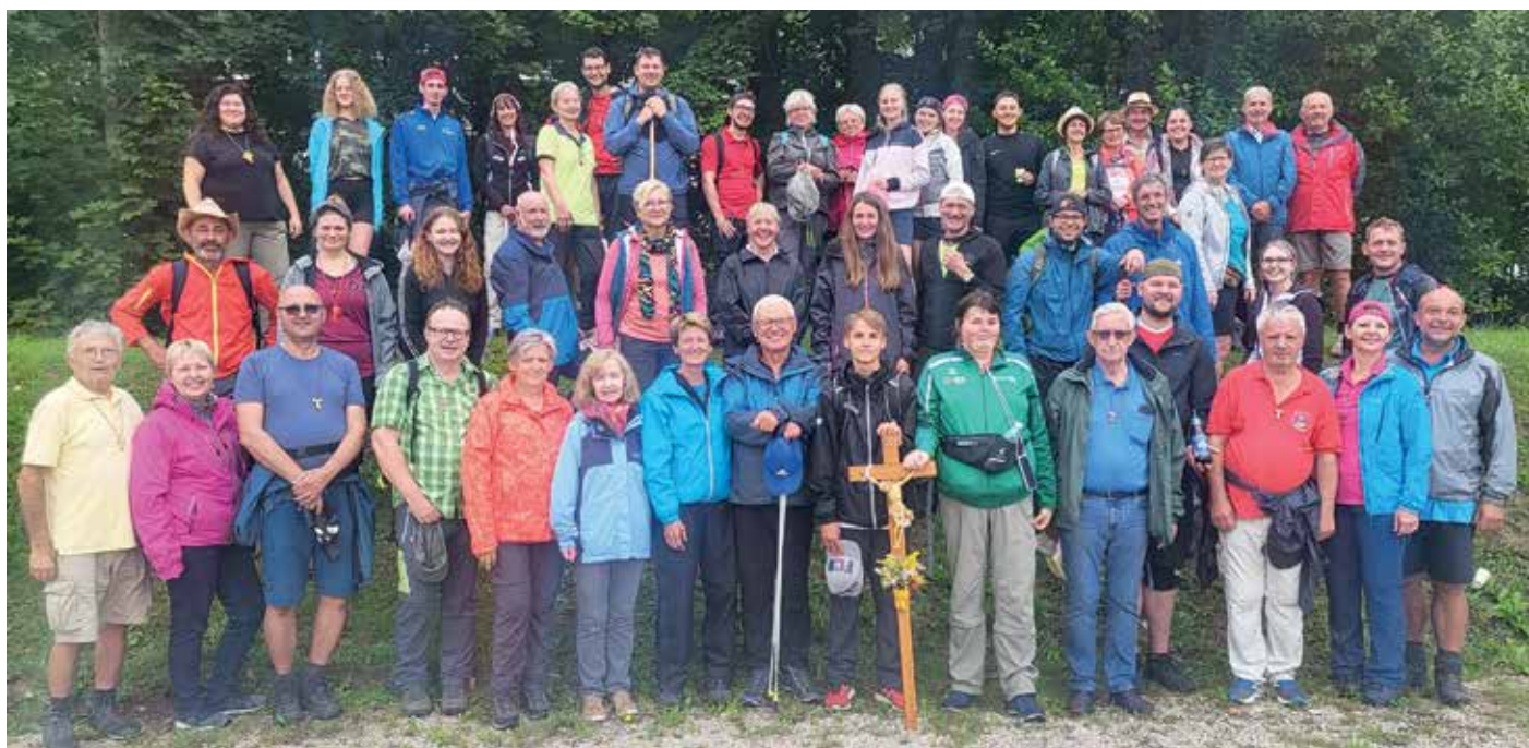
Die TeilnehmerInnen an der 38. Fußwallfahrt nach Mariazell

An Gott glauben, hieß für Maria nichts anderes als Gott lieben, mit Gott leben, zu ihm beten, mit ihm rechnen, auf ihn und sein Wort hören, seine Nähe suchen. Darin möchte sie auch uns Vorbild sein. Irgendwo steht auf einer Kirchentür geschrieben: „ Wenn der Gottesdienst endet, fängt der Gottesdienst (erst) an! “ Könnte man diesen Spruch nicht auch auf eine Wallfahrt anwenden und sagen: Wenn der Gottesdienst in einer Wallfahrtskirche zu Ende ist, dann fängt der Gottesdienst im Alltag erst an. Erst im Alltag, dort, wo unser Platz im Leben ist, mitten unter den Menschen, mit denen wir tagtäglich zusammen sind, muss sich zeigen und bewähren, was uns bei einer Wallfahrt aufgegangen ist, was wir dort gefeiert und erfahren, was wir uns vorgenommen und versprochen haben